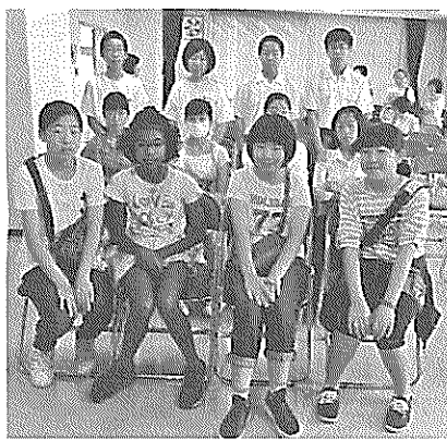
庚午中ボランティア